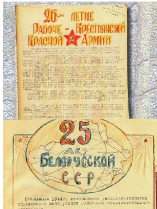
Праздничные открытки в партизанских журналах (фрагменты)