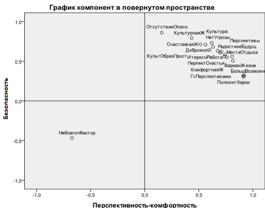
Рис.3. Пример (2) графической интерпретации респондента группы горожан с диффузной идентичностью

Обработка результатов, полученных на основе применения психосемантического метода репертуарной решетки с последующим факторным анализом, позволила получить данные о том, что жители с диффузной идентичностью описывают город с помощью когнитивно простого алфавита конструкторов, содержание которых не относится к значимым для города социально-экономическим, культурно-образовательным характеристикам.