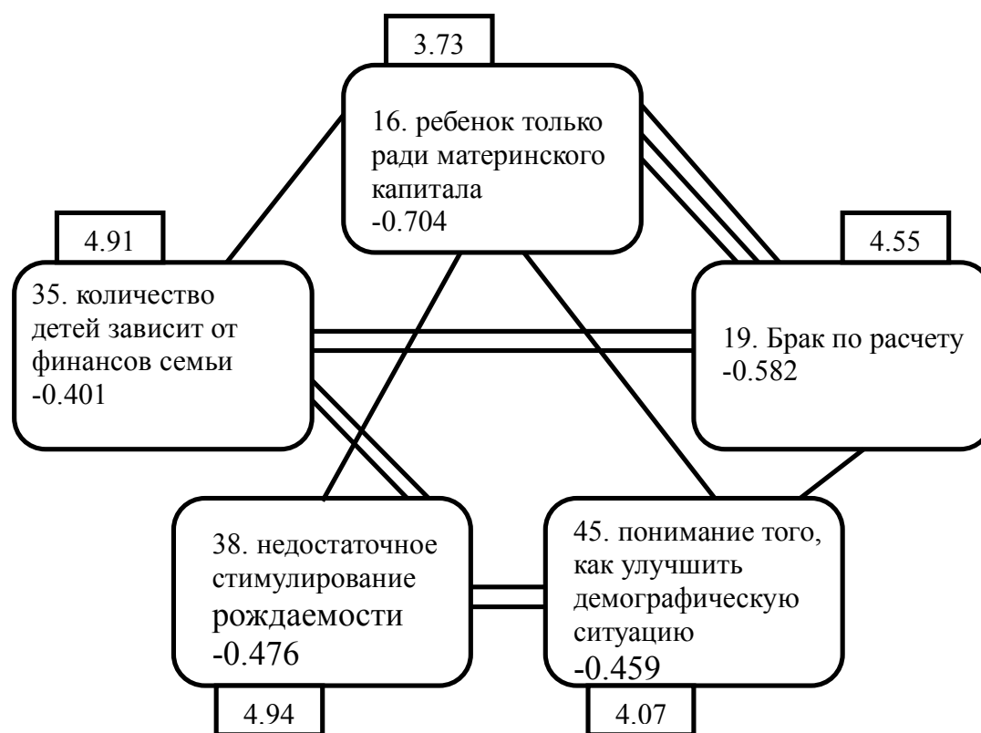
Рис. 3. Фактор прагматических ориентаций при планировании семьи

Четвертый фактор назван « Фактор ответственности за воспитание детей ». Он отражает ответственность государства за обеспечение благоприятных условий для рождения и воспитания детей, а также ответственность общества за поддержку имиджа многодетных семей, позитивного отношения к ним как ячейке общества, в которой формируется взаимопомощь и ответственность граждан.