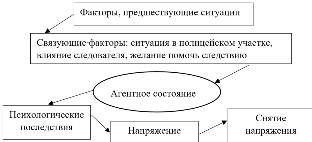
Рис. 2. Механизм возникновения и действия «агентного состояния» (Милгрэм, 2017, с. 206)

В целях объяснения психологического состояния свидетелей при опознании подозреваемых следователям целесообразно учитывать возникновение у первых «агентного состояния».