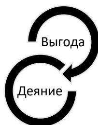
Рис. 2. Структура «черной» коррупции

На основании анализа коррупционных практик, входящих в выделенные факторы, можно предложить следующие модели, характеризующие социальные представления, называемые «черной», «серой» и «белой» коррупцией (см. рис. 2-4).