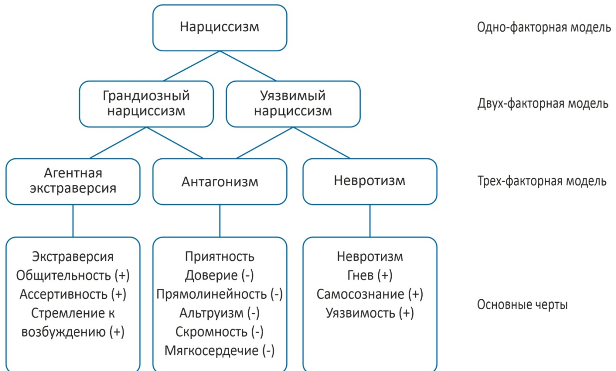
Рис. 1. Структурная модель нарциссизма (цит. по: Miller et al., 2021)

Перейдем к рассмотрению структуры нарциссизма, включающей в себя различные компоненты. Актуальные концепции выражаются в осмыслении его как отдельной черты личности и разработке моделей (Crowe et al., 2019; Miller et al., 2021) – двухкомпонентной, включающей в себя грандиозный (или открытый) и уязвимый (или скрытый) нарциссизм, и трехкомпонентной, состоящей из агентной экстраверсии, антагонизма, нарциссического невротизма (см. рис. 1).