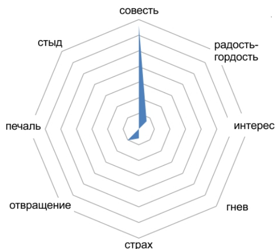
Рис. 2. Эмоциональный спектр текстов со страницы сайта ВОЗ, посвященной пандемии

с сайта Всемирной организации здравоохранения, со страницы, специально посвященной борьбе с пандемией. 2