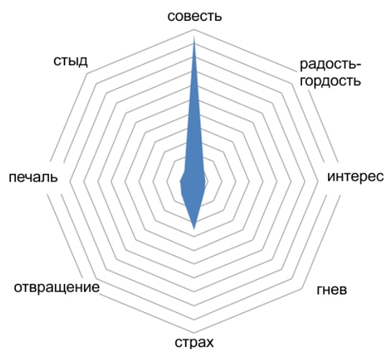
Рис. 3. Эмоциональный спектр текстов со страницы сайта ООН, посвященной пандемии.

Очень похожий спектр эмоций содержит подборка материалов по теме пандемии на сайте ООН (см. рис. 3). 3